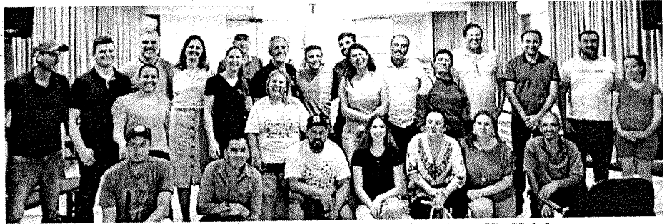
Encontro do novo PV de Beltrão, com dirigentes dos partidos aliados, PT e PC do B.